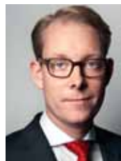
Tobias Billström, migrationsminister.

– Jag kan bara konstatera att nu har vi implementerat EU:s lagstiftning med familjeåterföreningsdirektivet i svensk lag och